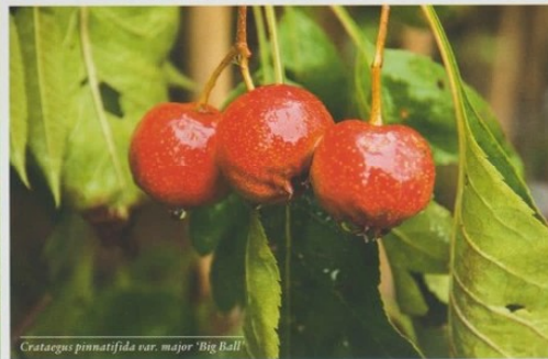
Crataegus pinnatifida var. major 'Big Ball'

Bomen en heesters zijn de jas van de tuin en soms ook het dak: ze geven beschutting en zorgen op hete zomerdagen voor schaduw. Bloem, blad, vruchten en schors strelen het oog, elk op hun beurt. Kwekers staan aan de basis van dit tuingeluk, met een speciale rol voor Kwekerij Arborealis in Wilhelminaoord.