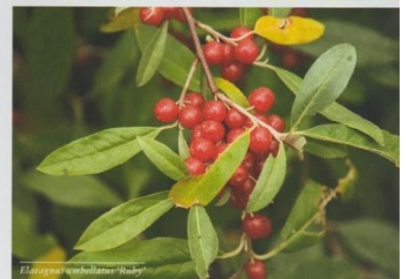
Elaeagnus umbellatus 'Ruby'