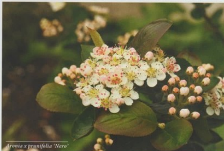
Aronia x prunifolia 'Nero'