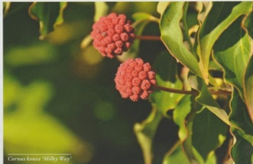
Cornus kousa 'Milky Way'