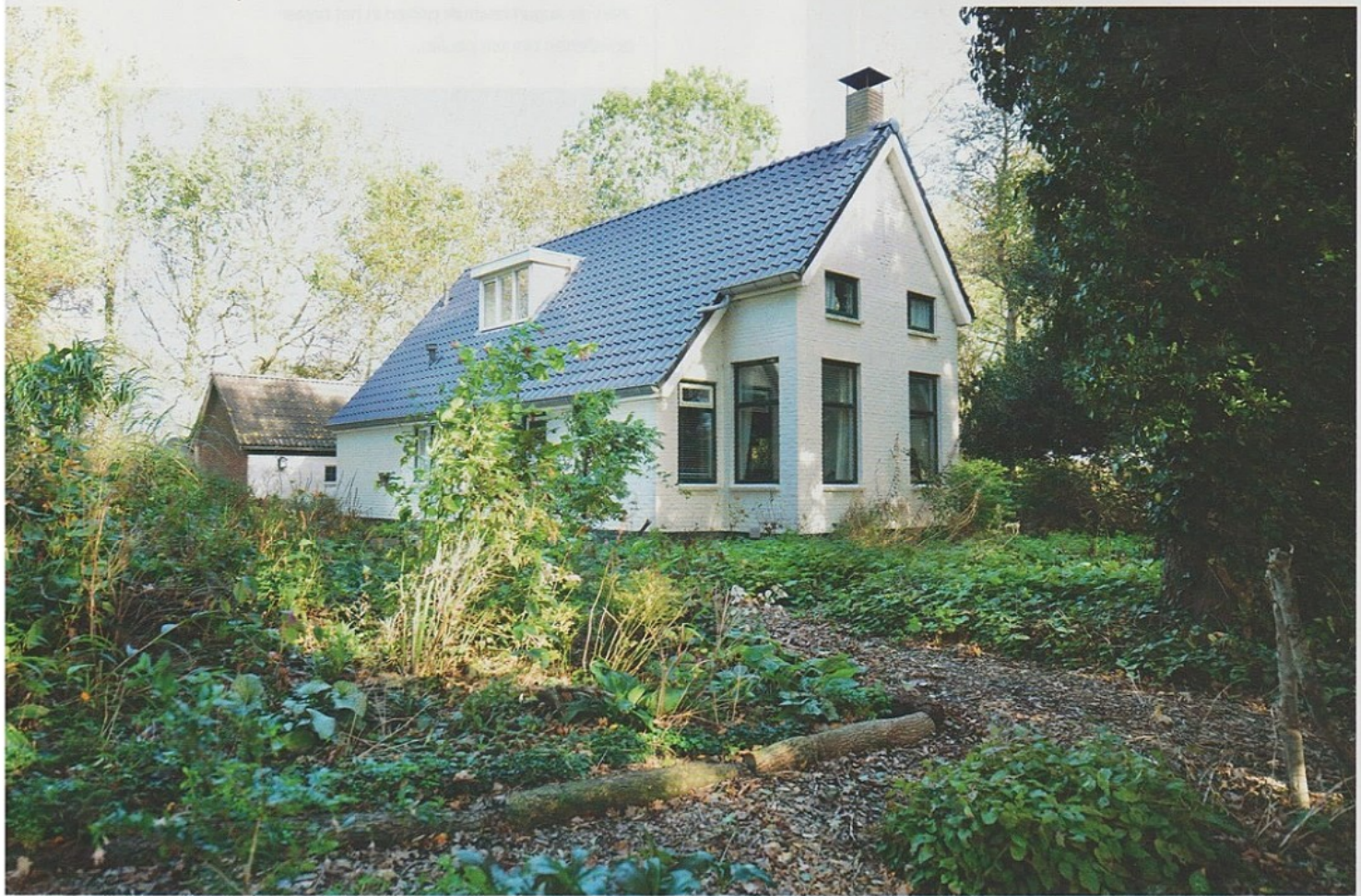
Rond het huis is er plek voor een bostuin vol schaduwplanten.