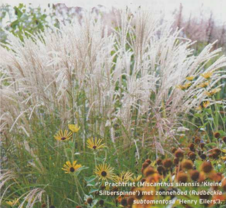
Prachtriet ( Miscanthus sinensis 'Kleine Silberspinne') met zonnehoed ( Rudbeckia subtomentosa 'Henry Eilers').