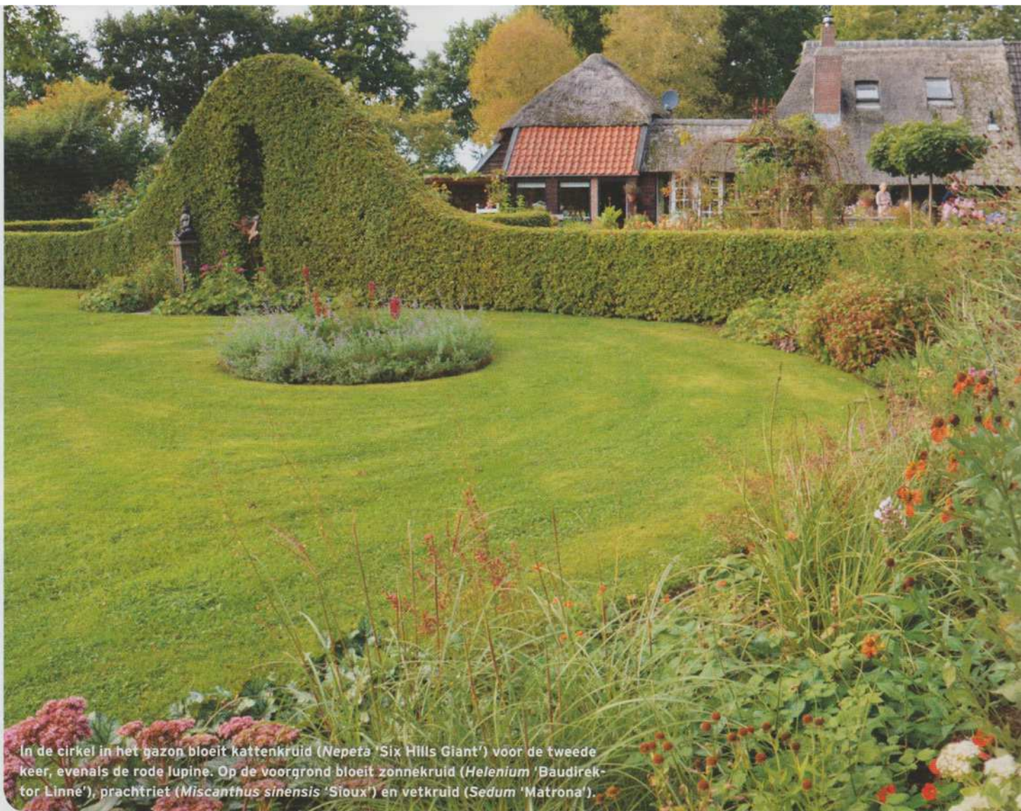
In de cirkel in het gazon bloeit kattenkruid ( Nepeta 'Six Hills Giant') voor de tweede keer, evenals de rode lupine. Op de voorgrond bloeit zonnekruid ( Helianthus 'Baudirektor Linne'), prachtriet ( Miscanthus sinensis 'Sioux') en vetkruid ( Sedum 'Matrona').

Met de najaarszon in onze rug is het prettig vertoeven in de tuinen Roos van Hijken. Meterslange borders zijn uitgedost met een vrolijke mix van kleuren. De eigenaren van deze tuin schuwen kleuren duidelijk niet: waar veel mensen oranje en gele bloemen vermijden, vormen het hier de subtiële zonnestraaltjes. En het werkt. Je krijgt er een instant energieboost van. Vaste planten, rozen, heesters en eenjarigen, waaronder ook veel dahlia's, wisselen elkaar steeds af in de borders. De aren van siergrassen weven door de beplanting en vangen de glinstering van het lage zonlicht. Een warm najaar is hier een feit.