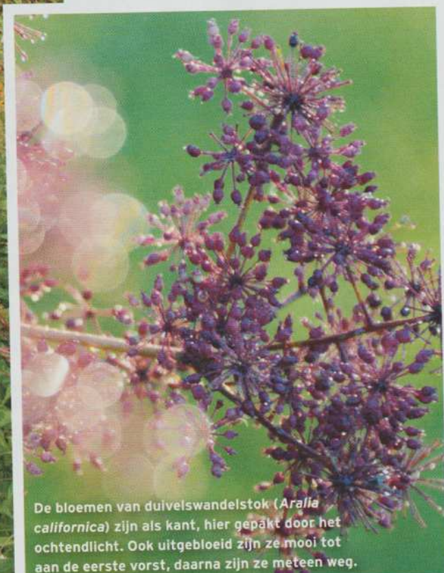
De bloemen van duivelswandelstok ( Aralia californica ) zijn als kant, hier gepakt door het ochtendlicht. Ook uitgebloeid zijn ze mooi tot aan de eerste vorst, daarna zijn ze meteen weg.